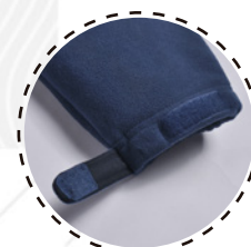
MANGA CON VELCRO