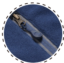
CIERRE CON APLICACIÓN REFLECTIVA